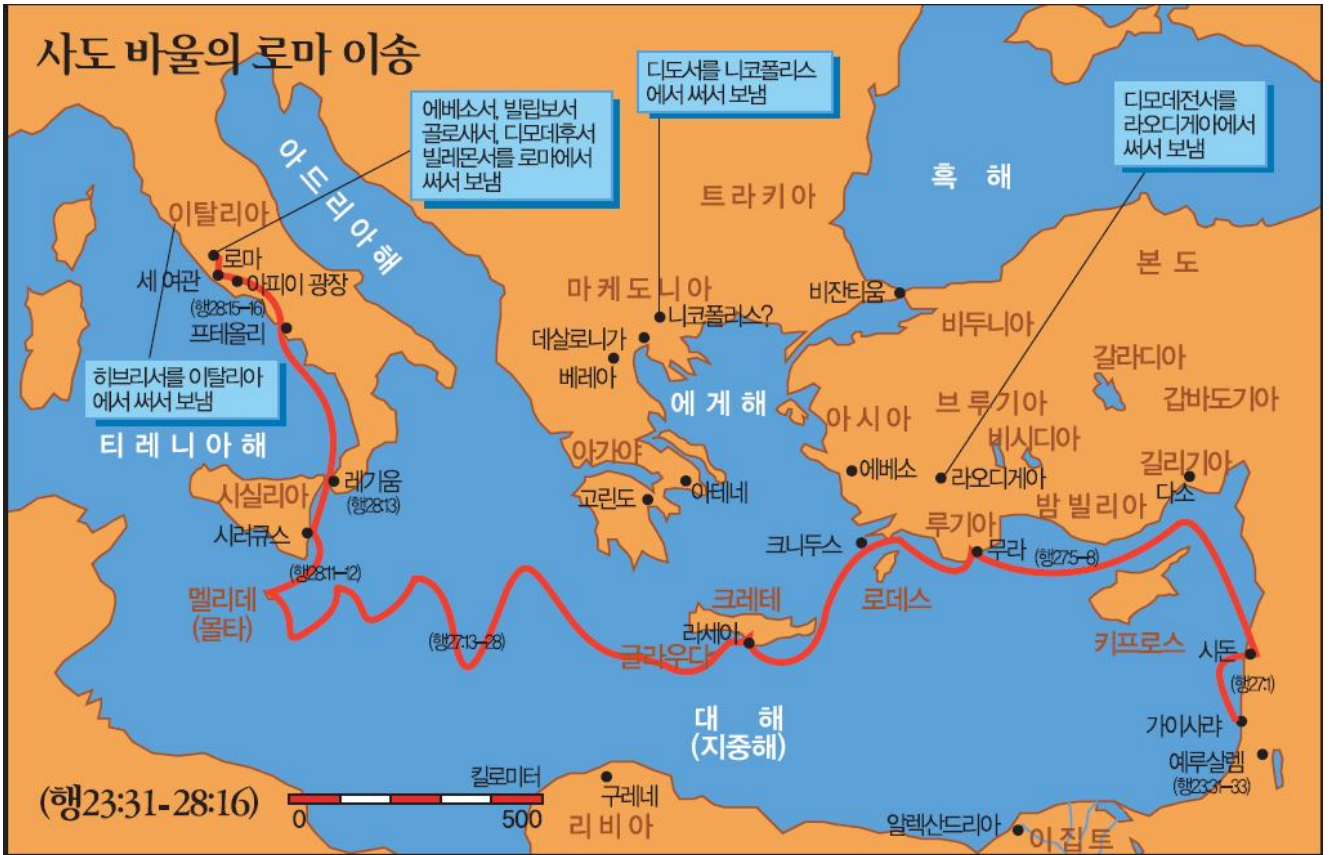
출처: 에스라 성경사전(그리스도 예수안에)

121. 바울을 로마로 이송하는 일에 책임을 맡은 사람으로 바울에게 친절히 대우해 줬던 인물은 누구입니까? 121)